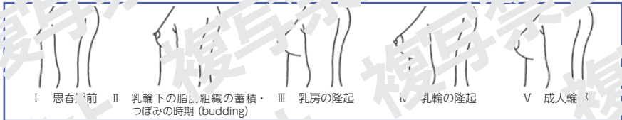
図 乳房の発達過程